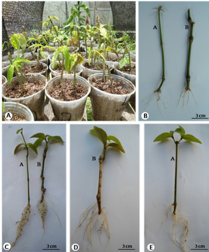
Figura 2 A: Aspectos gerais das estacas caulinares de Justicia wasbaueriana Profice no substrato vermiculita. B: Estacas caulinares apicais (A) e basais (B) após 20 dias. C: Estacas caulinares apicais (A) e basais (B) após 45 dias. D e E: Estacas caulinares basais (B) e apicais (A) após 60 dias.

é um fator determinante para o sucesso no enraizamento de estacas em muitas espécies (Lima et al. 2003), pois o crescimento depende de condições físicas e químicas do substrato utilizado e das substâncias de reserva que a planta utiliza para a divisão e alongação celular das raízes (Pescador et al. 2007).