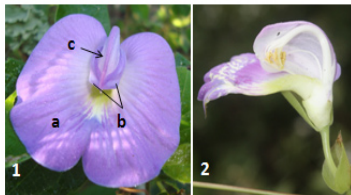
Figura 2 Centrosema vexillatum 1: flor em vista frontal, de mostrando o vexilo (a), as alas (b) e a carena (c); 2: flor em corte longitudinal, mostrando no interior da carena, os estames e o estigma.

Os visitantes florais buscavam o néctar produzido por C. vexillatum . O vexilo funciona como uma plataforma de pouso para os visitantes que pressionam as pétalas da carena para alcançar o interior do tubo floral onde o néctar encontra-se e neste processo entra em contato com as estruturas reprodutoras da flor. Em C. pubescens ,