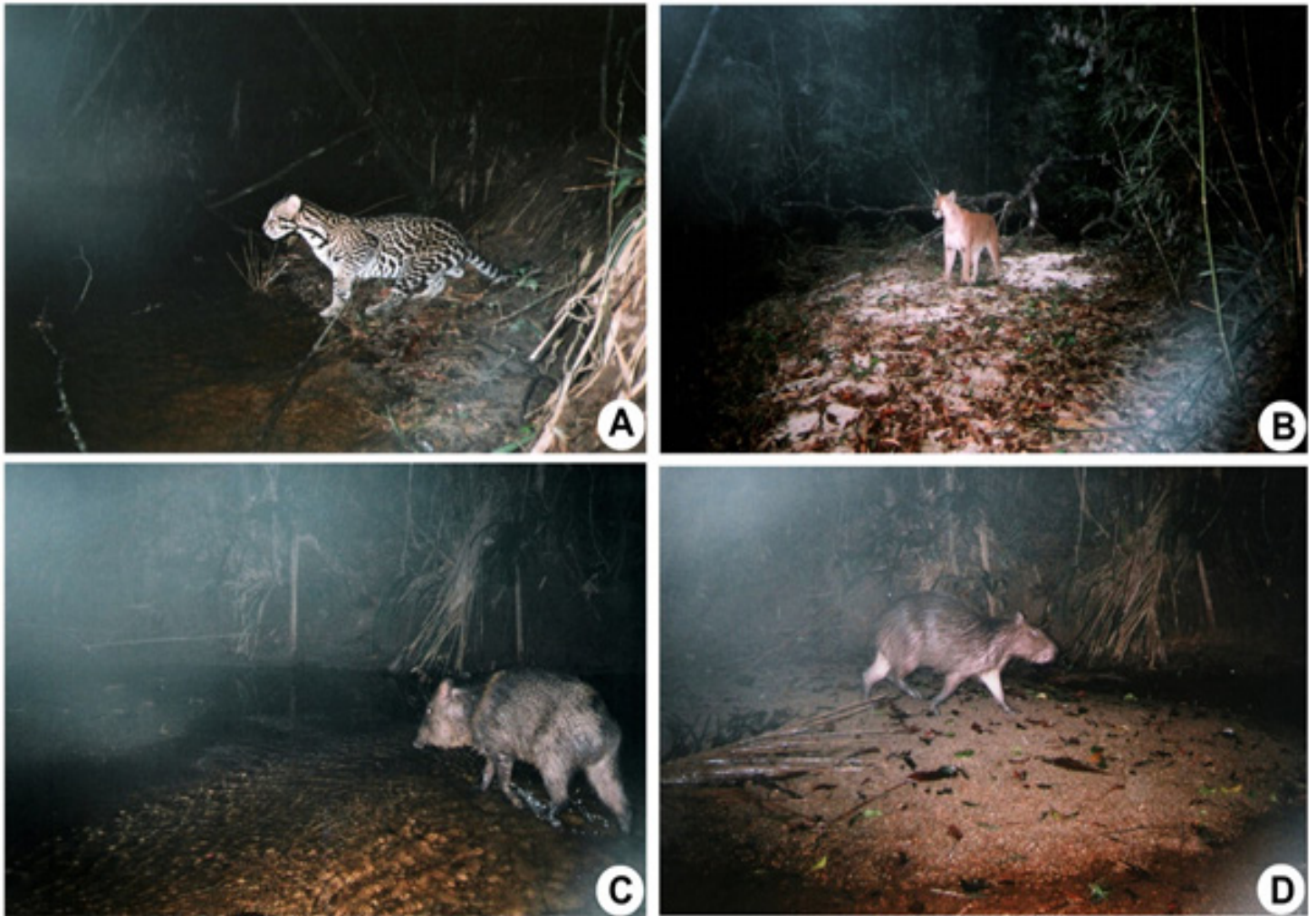
Figura 2 Registros de quatro dos 18 mamíferos silvestres registrados pelas armadilhas fotográficas, durante o período de agosto a novembro de 2008, na Reserva Biológica Augusto Ruschi, Santa Tereza, Espírito Santo, sudeste do Brasil. A = Leopardus pardalis ; B = Puma concolor ; C = Pecari tajacu ; D = Hydrochoerus hydrochaeris .

incluindo uma espécie doméstica, distribuídas em oito ordens: Artiodactyla, Carnivora, Cingulata, Didelphimorphia, Lagomorfa, Pilosa, Primates e Rodentia (Tabela 1). Dentre as espécies registradas, ressaltamos a presença da preguiça-de-coleira ( Bradypus torquatus ), do miquiqui-do-norte ( Brachyteles hypoxanthus ), da onça-parda ( Puma concolor ), da jaguatirica ( Leopardus pardalis ), da irara ( Eira barbara ) e do cateto ( Pecari tajacu ) (Figura 2). Também ressaltamos a ausência de registro da onça-pintada ( Panthera onca ), do queixada ( Tayassu pecari ) e da anta ( Tapirus terrestris ).